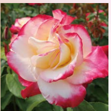
红双喜 (Double Delight)

以产自中国的玫瑰香气成分为特征。基于绿色紫罗兰的香气, 给人以高贵优雅的印象。香味中等。