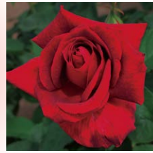
米兰爸爸 (Papa Meiland)

与大马士革古典 (Damask Classic) 的香气相比, 更加热情、高雅的香气。