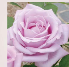
蓝月亮 (Blue Moon)