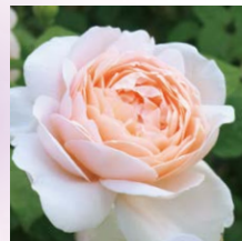
安布里奇玫瑰 (Ambridge Rose)

如同香草的甜没药 (Myrrhis odorata) 的香气。虽然是青草味稍强的香气, 但是能够与大马士革 (Damask) 系以及茶香系香气良好协调。在英国玫瑰中有很多。