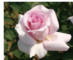
Fragrant Hill (第1次国土交通大臣奖)

这也是特别针对珍奇香气的新品种大赛。为了重新评价在交配过程中逐渐消失的玫瑰的“香气”魅力, 进一步完善芬芳玫瑰园, 从2005年开始举办这项活动, 继续在本公园栽培获奖玫瑰中特别优秀的品种。