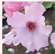
俏丽贝丝 (Dainty Bess)

以大马士革古典 (Damask Classic) 香气为基础, 可以感到类似作为香料使用的丁香 (丁子) 略微强烈的香气。野蔷薇以及单瓣的品种大多是这种香气。