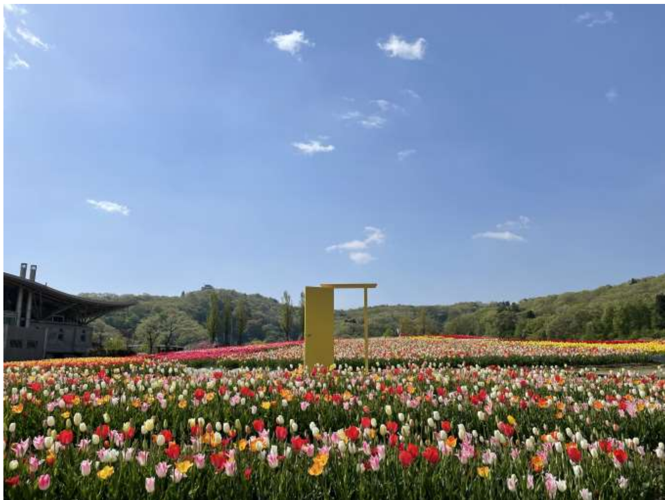
花の丘チューリップの様子（過年度撮影）

国営越後丘陵公園 令和6年度の年間イベントの日程について、別紙の通りご案内いたします。 皆様には御多忙中のことと存じますが、取材並びに記事掲載を賜りますようお願い申し上げます。