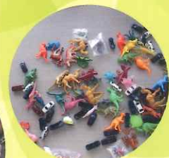
好きな素材を選べるよ！

開催場所：国営越後丘陵公園 花と緑の館 体験学習室 開催日時：2022年8月15日(月) 15時～17時(時間内随時受付) 8月16日(火) 10時～12時(時間内随時受付)