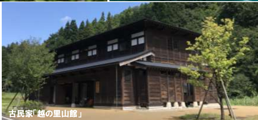
古民家「越の里山館」