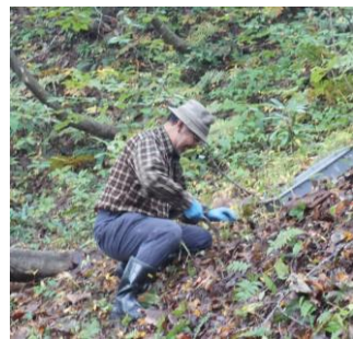
昨年度植栽風景 令和元年10月27日撮影

皆様には御多忙中のことと存じますが、取材並びに記事掲載を賜りますようお願い申し上げます。