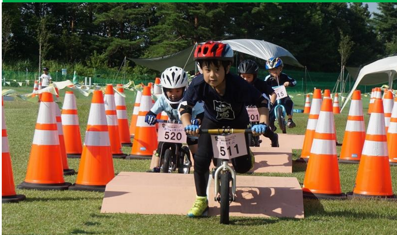
昨年開催の様子（2019年7月28日撮影）

国営越後丘陵公園「あそびの里」において、10月3日（土）に 第3回ランニングバイクレース越後丘陵公園カップを開催 します。只今、参加者を募集しています！