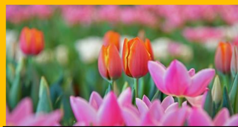
アイスチューリップ展示 1/23（土）～2/14（日）