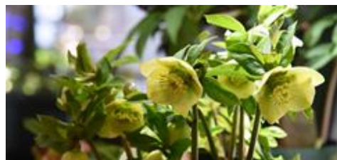
クリスマスローズフェスタ 2/20（土）～28（日） 屋外花壇：開花時期4月中旬～下旬