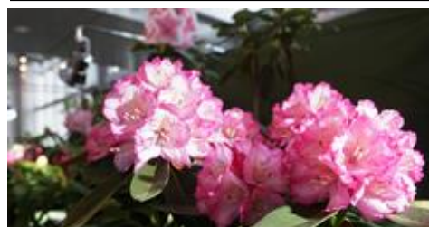
シャクナゲ展示 3/23（火）～