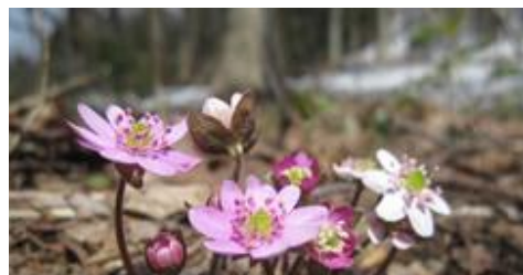
雪割草まつり 3/13（土）～4/11（日） 雪割草群生地：開花時期3月末～4月中旬