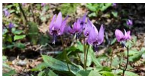
かたくり百万株まつり 4/3（土）～11（日） カタクリ大群落：4月上旬～中旬