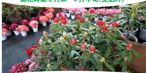
シャクナゲ展示 3/27(火)～