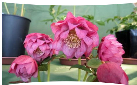
クリスマスローズフェスタ 2/17(土)～2/25(日) 屋外花壇：開花時期4月中旬～下旬(見込み)