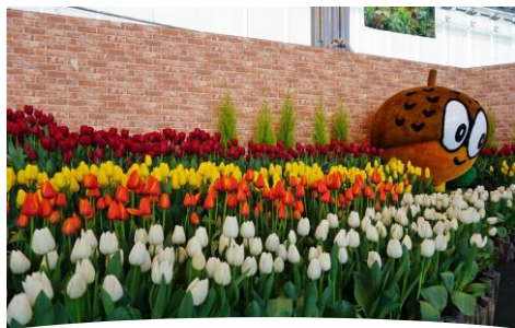
アイスチューリップ展示 1/27(土)～2/18(日)