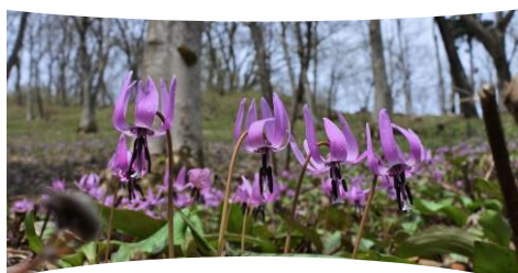
かたくり百万株まつり 4/7(土)～4/15(日) カタクリ大群落： 開花時期4月上旬～中旬(見込み)