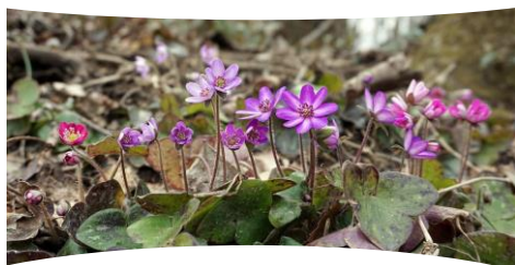
雪割草まつり 3/10(土)～4/15(日) 雪割草群生地： 開花時期3月末～4月中旬(見込み)