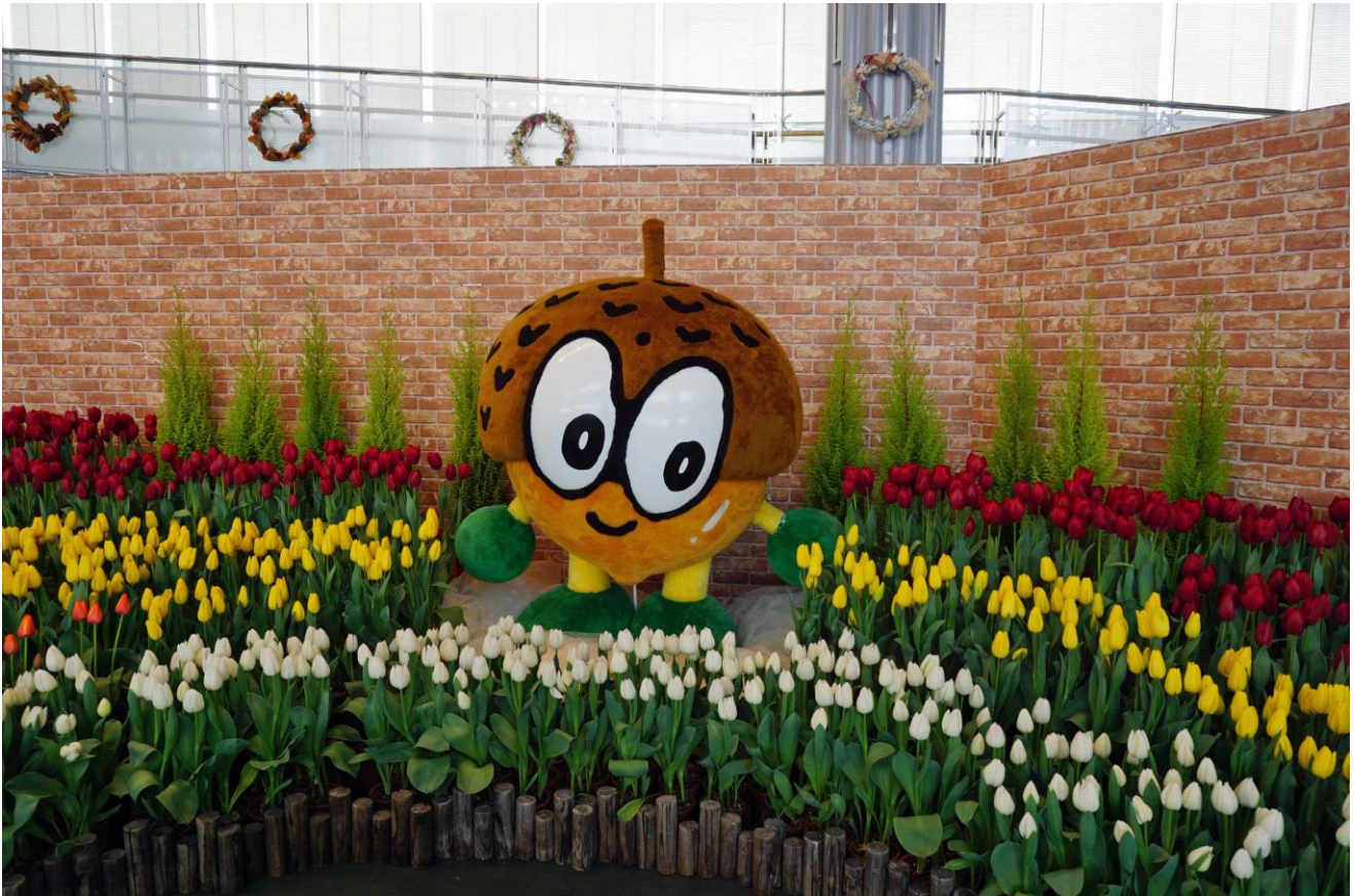
昨年の展示風景 平成29年3月1日撮影