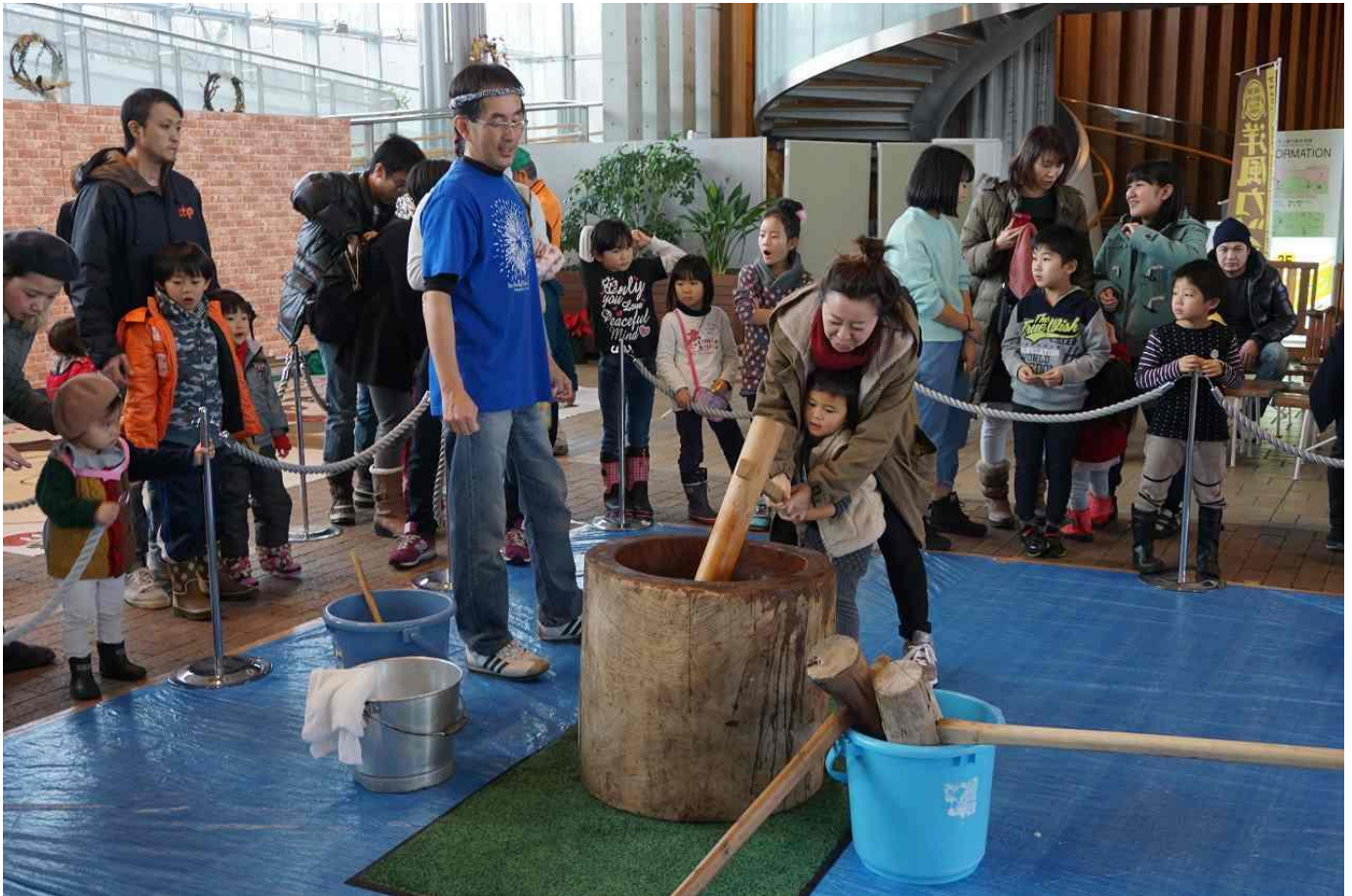
過年度の実施風景