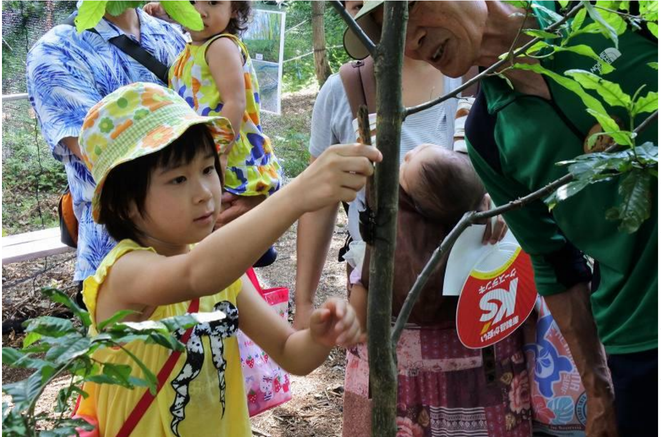
カブトムシ捕まえられるかな？（平成29年7月22日撮影）