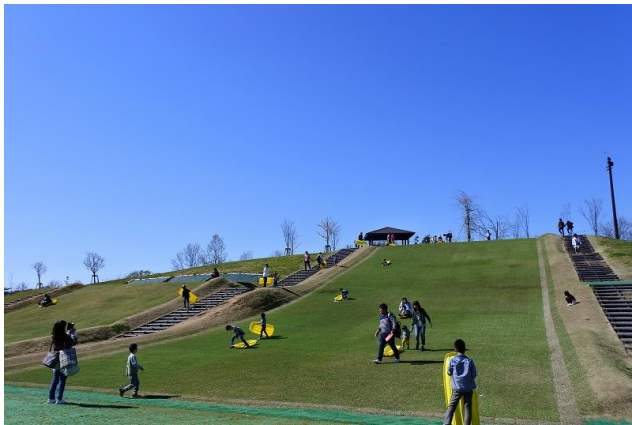
40mのロング芝ソリゲレンデが…

公園の人気スポットのひとつ「芝ソリゲレンデ」を夜間も開放し、七色に輝く「光のゲレンデ」として新登場！