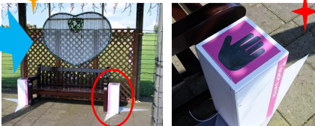
ハートのベンチに仲のいい2人が手を繋ぎ、スイッチにタッチするとイルミネーションがさらに輝きます！