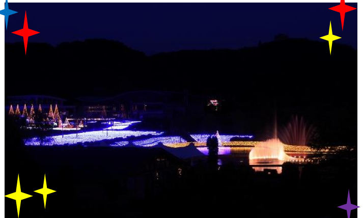
自然探勝路橋からの景色