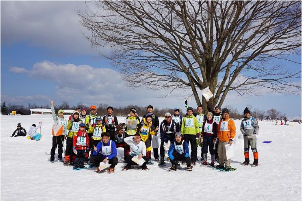
ロゲイニング大会（昨年のプレ大会の様子）

謹啓 残寒の候 皆様方におかれましてはますますご健勝のこととお慶び申し上げます。