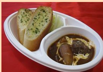
ビーフシチュー 500円