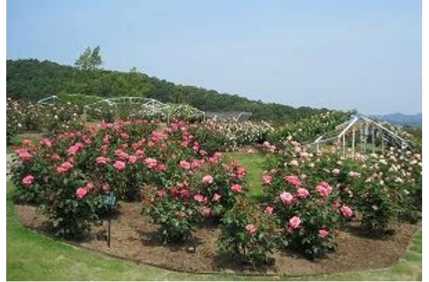
香りのばら園(香りのエリア)

※出典 NHK 趣味の園芸ガーデニング 21 バラを美しく咲かせるとおきの栽培テクニック (2007.11.20 鈴木満男 著、日本放送出版協会発行 P10 より一部引用)