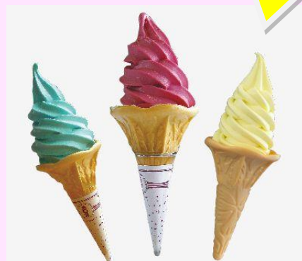
左から、青ばら、赤ばら、黄ばら、ソフトクリーム