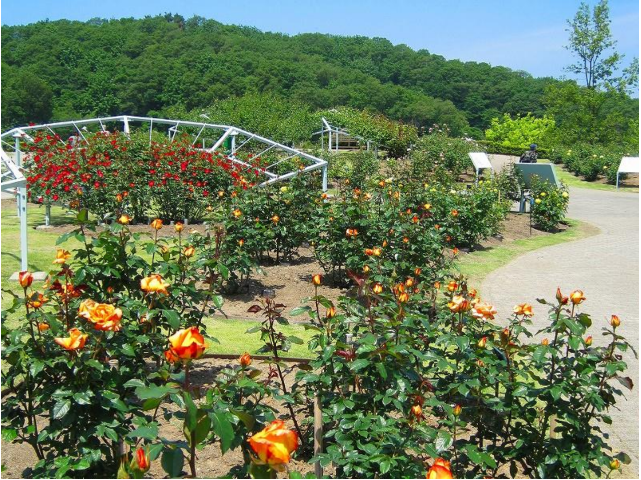
つぼみが膨らみ、開花が待ち遠しいばら。(平成二十四年五月三十一日撮影)