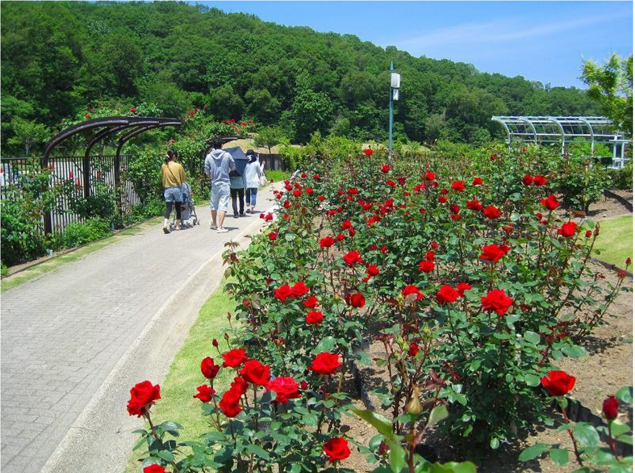
本日のばら園の様子。(平成二十四年五月三十一日撮影)