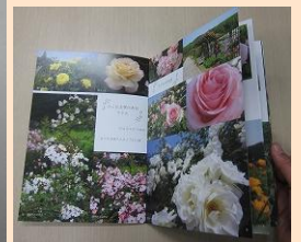
香りのばら園の魅力が詰まった『香りのばら園フォトブック』