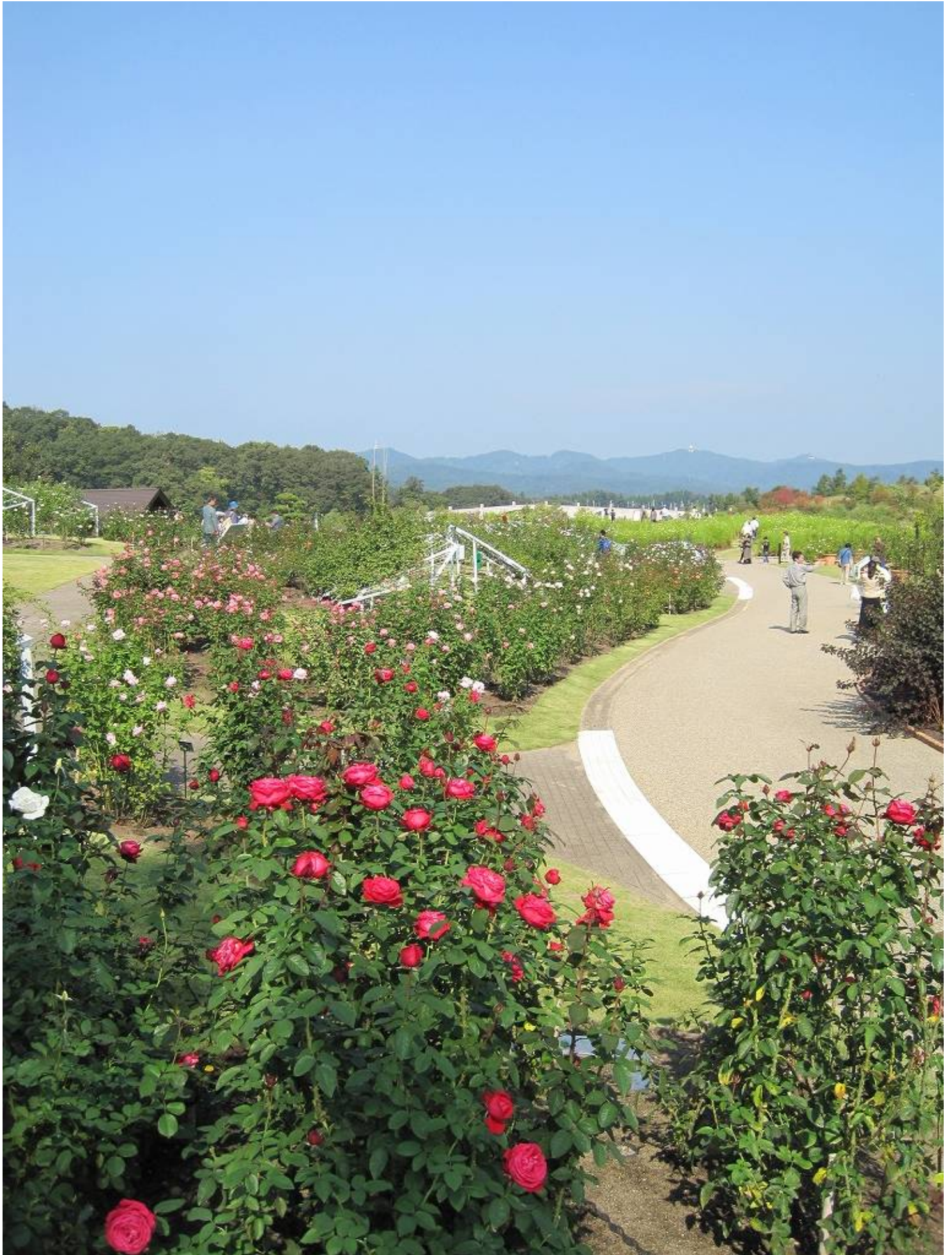
(平成 23 年 10 月 10 日撮影)