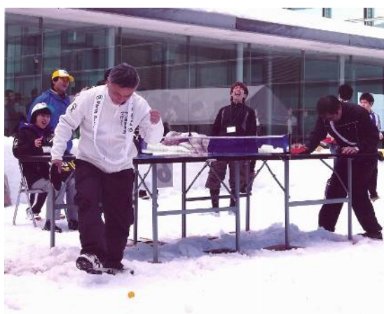
長岡観光コンベンション協会賞