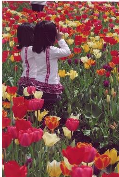
マイスキップ賞 「ツーショット」