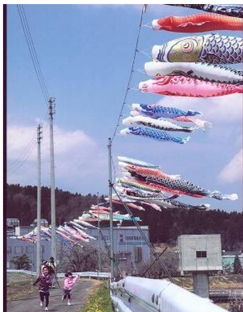
長岡信用金庫賞 「元気いっぱい」