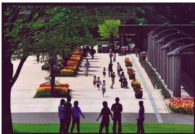
新潟日報社賞 「着いたぞ～」