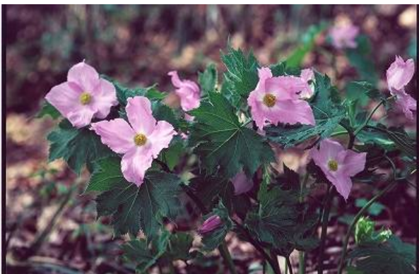
新潟フジカラー賞「シラネアオイ」