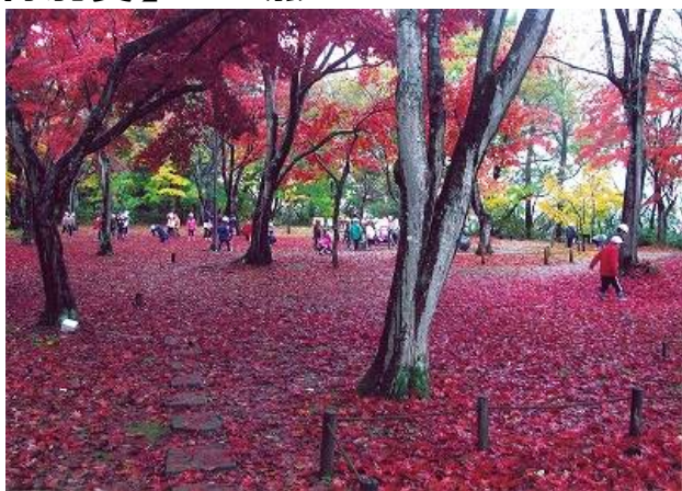
高齢者総合施設 縄文の杜関原賞