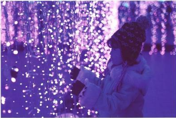
BSN新潟放送賞「ゆめ心」