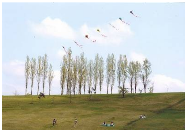
長岡西部マップの会賞 「タコ揚げ日和」