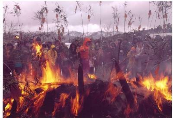
UX新潟テレビ21賞「賽の神」