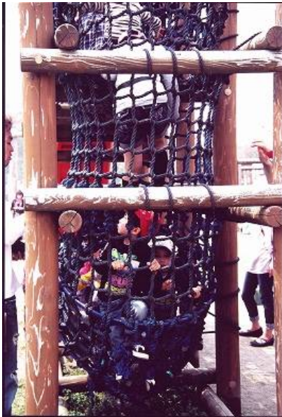
TeNYテレビ新潟賞「過密地帯」