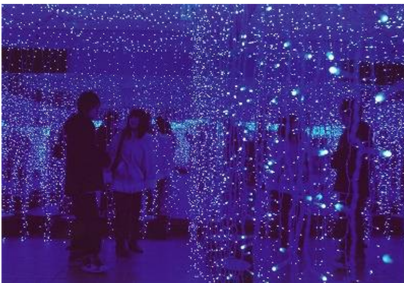
長岡市長賞「二人の世界」