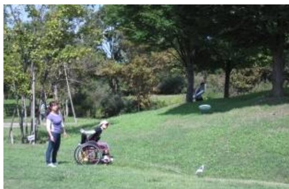
【第3回大会の様子】(平成22年9月25日・26日)