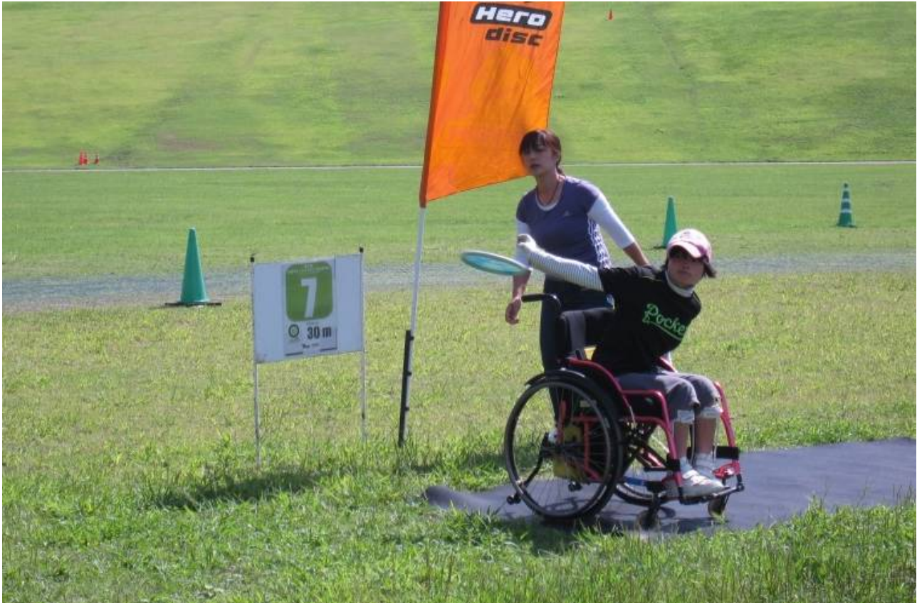
第三回大会の様子(平成二十二年九月二十六日撮影)