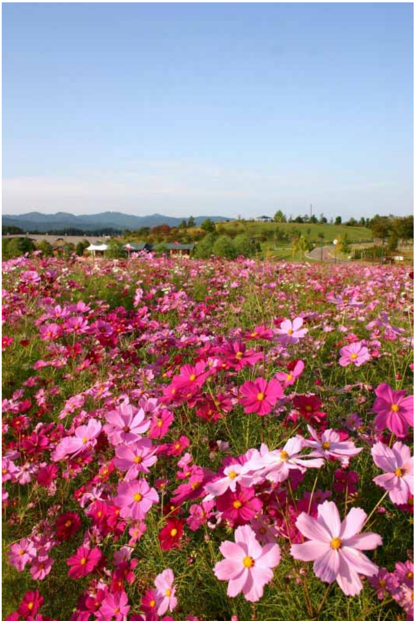
平成三十年十月十日撮影