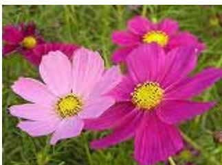
“スーパービッキー”