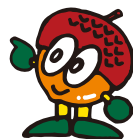
公園キャラクター：ころりん