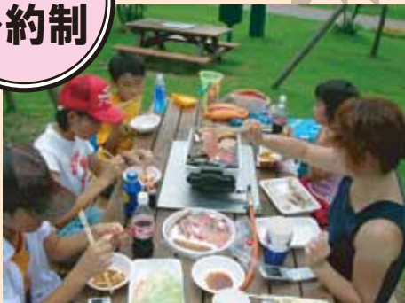
みんなでワイワイ、自然の中でおしゃべりしたいのしもう！